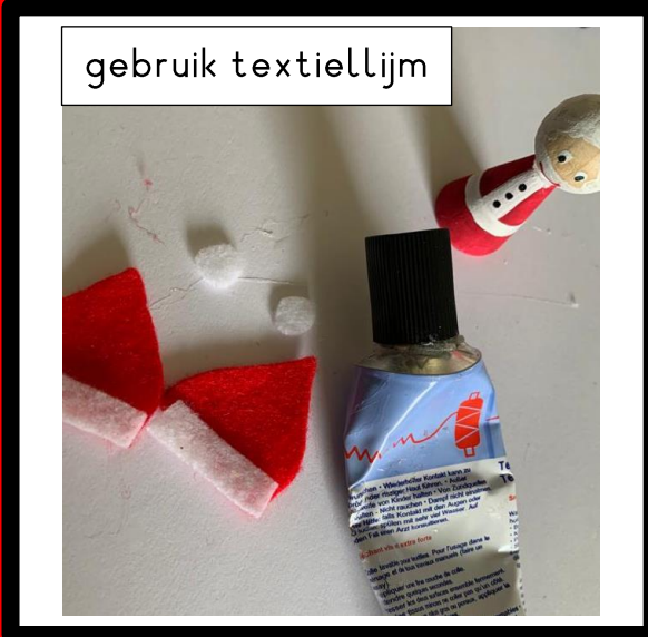
gebruik textiellijm Knip de witte details voor de muts uit en plak op.