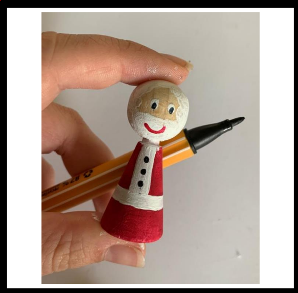
Teken de pupillen en knopen met stift.