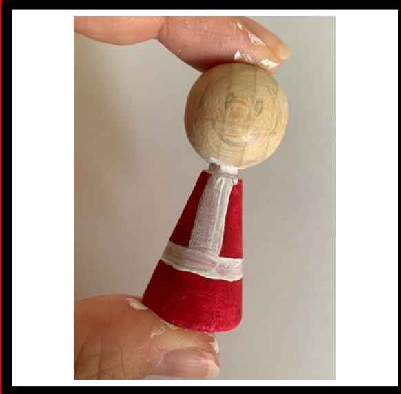
Verf de details op het lijf, de witte verf = 2 lagen.