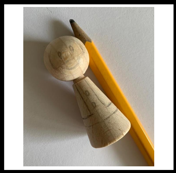
Teken globaal het figuur van de Kerstman.