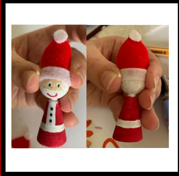
Plak de muts op de pop, houd vast tijdens drogen.