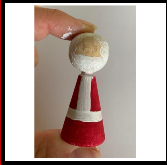
Verf de baard op het hoofd en laat drogen.