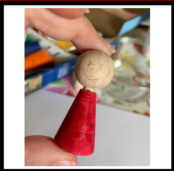
Verf de basislaag op het lijf en laat drogen.